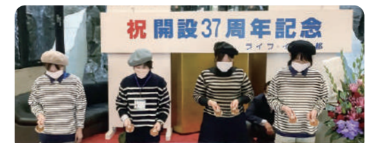
職員によるハンドベル演奏