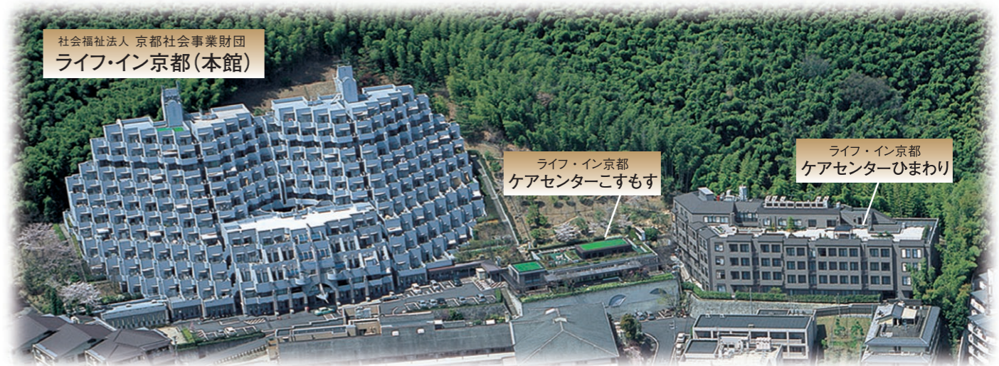
社会福祉法人 京都社会事業財団 ライフ・イン京都(本館)