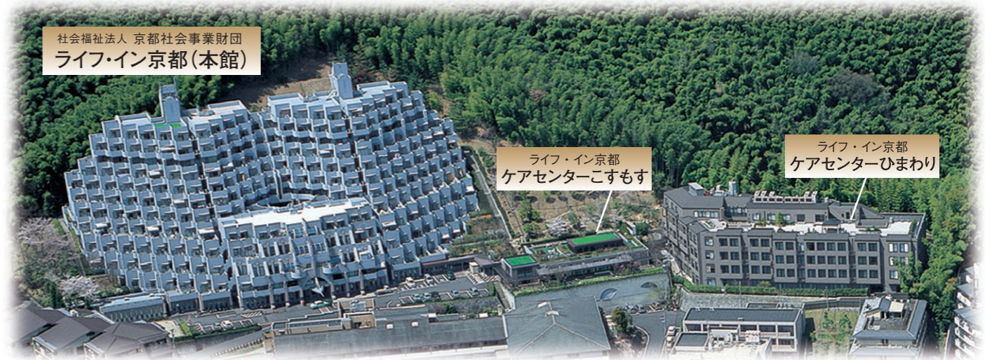
社会福祉法人 京都社会事業財団 ライフ・イン京都(本館)

【日めぐり京都365】 朝日新聞出版より編集・引用 *交通アクセス JR嵯峨野線「亀岡駅」より京阪京都交 通バス34、40、59、臨時系統で約10分 「運動公園前」下車すぐ。