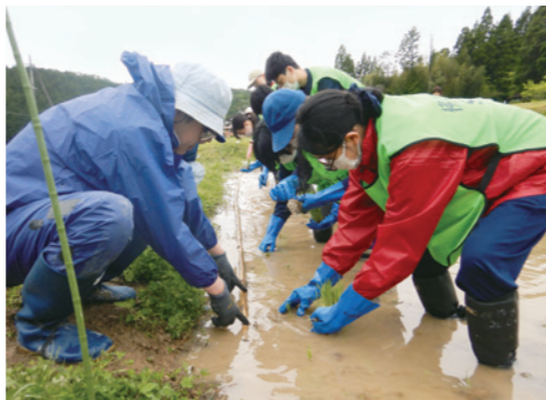
田植えを楽しんでいる様子@京都市北区氷室

私たちが健康も似たようなことが言えるのではないかと思います。確かに、体重、血圧、血糖値などの数値に注意を払う必要はあり、数値が基準を上回っていれば薬などでコントロールすべきです。ところが、たとえ血圧などが正常であっても病気になることはありますし、突発的な事故で身体に障害を負ったり、何らかの原因で認知機能が低下したりなど、いろいろなことが起こる可能性があります。将来の正確な予測は難しいとしても、なるべく事前に想定して対策を講じておくことと安心感につながります。例えば、ライフ・イン京都で推進されている「終末期医療に関する要望書」(「アドバンス・ケア・プランニング」)も将来の医療とケアについて前もって話し合う点では「適応」に近いといえます。他にも、まだ1年分の健康診断受診者の分析にとどまっていますが、土佐町で得られた農作業への姿勢と健康との関連を調べると、農作業が楽しい人のほうが楽しくない人より心身の状態が良好なことがわかりました。取り組んでいて楽しいことが簡単に見つかるわけではありませんが、年齢が高くなっても楽しめるアイテムを持っている人ほど日々健やかに過ごせる可能性が高まるだろうと思っています。このように、私たちは緩和にとどまらず、適応も含めて広い視点で物事に取り組みほうが有効だといえそうです。緩和と適応のバランスをとるというアイデアが一般的に普及し、健康にも普段から備える発想が広がってほしいです。