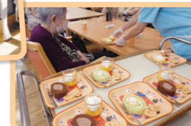
ハロウィンイベント ケーキ