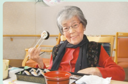
お食事会のご様子