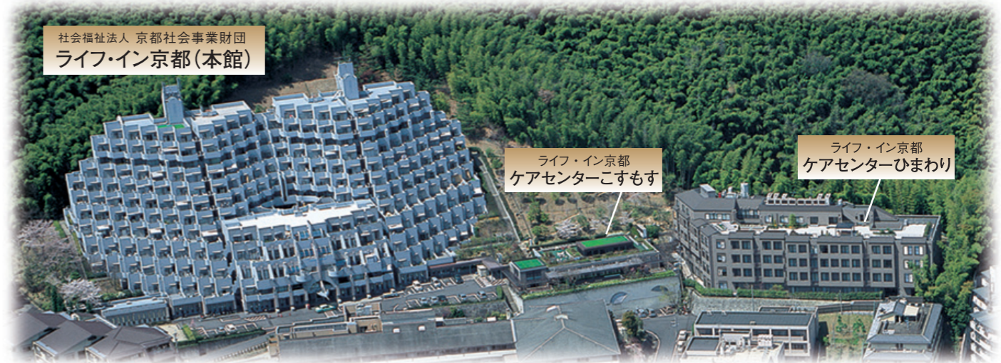
社会福祉法人 京都社会事業財団 ライフ・イン京都(本館)

白馬奏覧神事 年の始めに(二月七日)白馬(青馬)を見ると、二年の邪気が祓われる。そんな故事に則った宮中儀式「白馬節会」に由来する神事です。上賀茂神社では、神前に七草粥が供えられ、神馬の神山号が境内を歩きます。白馬を「あおうま」と読むのは、中国で生まれた五行説で春の色が青とされていることの名残ともいわれます。神事の後には、この日食べると縁起がよいとされる七草粥の接待(有料 ※中止の場合もあり)もあります。 「日めぐり京都365」 朝日新聞出版より編集・引用