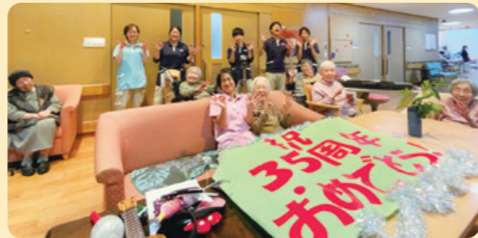
※撮影時のみマスクを外しております。

「ひとつなぎ」をテーマにご入居者、法人会長、ホーム役職員、委託業者の職員等ホーム運営に関わる方々から動画コメントをいただき、それをひとつなぎにした動画作品に仕上げ、館内ビデオ放送で放映しました。