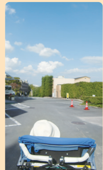
本館周辺をお散歩