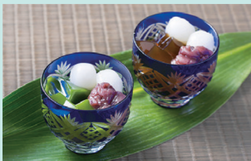
中村藤吉本店 生茶ゼリイ

<高山製菓>のころもちから始まり11月で第9回目になり、入居者の皆様からも、いろいろリクエストを頂いております。次回もご興味をもって頂けるようなお取り寄せをご案内できるように企画致しますのでお楽しみにしてください。