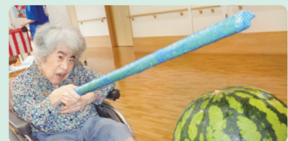
夏祭りのスイカ割り