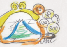
イラスト(足立明久)

六十数年前、私は大学入試に臨んでいた。試験開始のベルが迫り、会場は一瞬静まりかえる。と、その時、突然数枚の硬貨がチャリンチャリンと床に落ちる甲高い音がして場は凍りついた。どういうはずみか、自分がズボンのポケットから手を出した時に落ちたらしい。困惑しながらも、緊迫した雰囲気の中大慌てで拾い始めると、すぐに前席の受験生が手伝ってくれ、間一髪で開始時刻に間に合った。