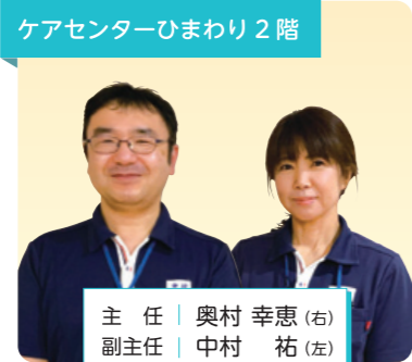
ケアセンターひまわり 2階

安心して頂けるような介護を心掛けていきたいと思っております。よろしくお願いいたします。