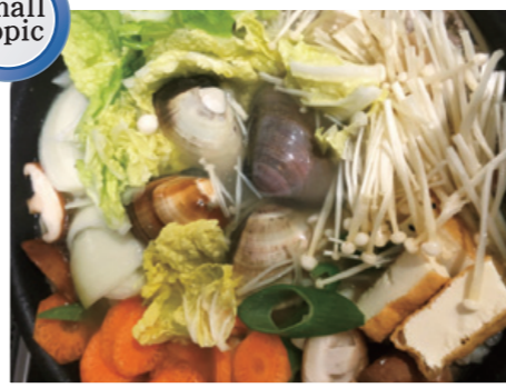
石本作成の美酒鍋(ハマグリ入り)