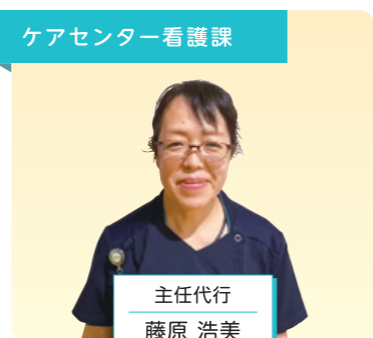
ケアセンター看護課

ご入居者の皆さんが笑顔で、楽しく過ごせるように気持ちに寄り添い頑張ります。これからもよろしくお願いいたします。