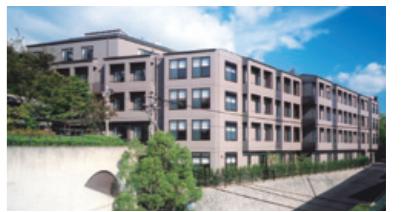
ケアセンターひまわり