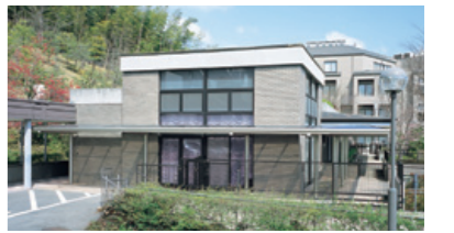
ケアセンターこすもす