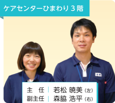
ケアセンターひまわり 3階

ご入居者様の思いを汲み取り、お一人おひとりの気持ちに寄り添ったケアができるよう心掛けていきます。よろしくお願いいたします。