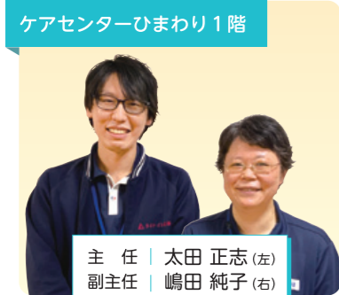
ケアセンターひまわり 1階