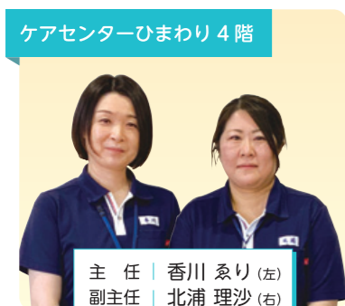
ケアセンターひまわり 4階