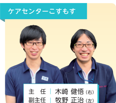
ケアセンターこすもす

ご入居者の思いを常に汲み取り日々穏やかに過ごして頂けるよう援助させていただきます。コロナ禍ではありますが感染対策をしっかり行い食事会等、楽しみを持って頂けるよう企画を考えていきます。