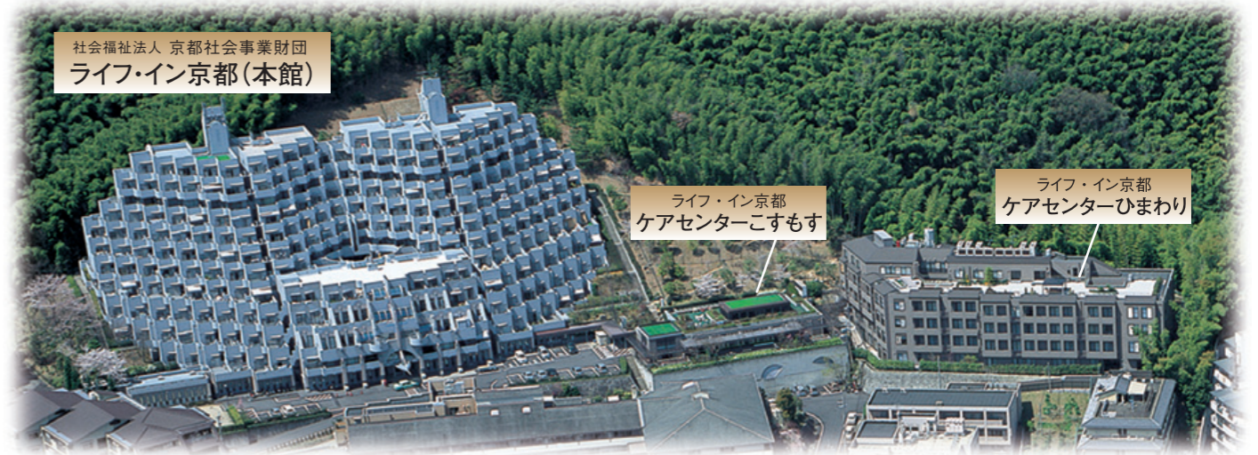
社会福祉法人 京都社会事業財団 ライフ・イン京都(本館)