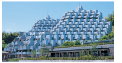
ライフ・イン京都