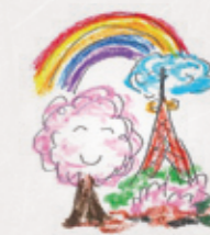
イラスト(足立明久)

だが、老人ならではの発達もあると言う。思うに、老年期に多くの喪失や病氣、心身の衰えという困難を生きたこと自体が、形はどうあれ、人それぞれの崇高な最後の輝きなのだ。また、老境に入ってからわかる視点や知恵もあり、それらを次世代への継承、日常の過ごし方や生き方など、様々な場面で活用することも可能だ。願わくは、私も自分ならではの発達を遂げ、その暁には「夢の楽園・花の天国」に、身も魂も吸い取られてうわの空になっても、その時は行き先を間違わずに、「天国一枚」と言えるようになりたい。 (二〇二〇号 足立明久)