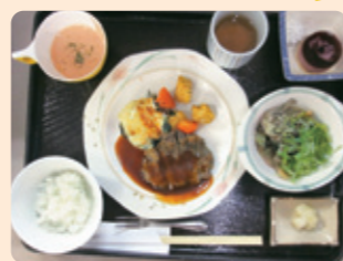
B 牛ハレのシャリアピンステーキ きのこサラダ/ご飯/香の物/ 人参のポタージュスープ/ ダブルベリームースケーキ