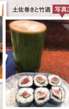
写真3 土佐巻きと竹酒

お世話になった先生を訪ねて高知県に行ってきました。高知県といえば、蕁焼きのカツオのたたきでしょう(写真2)。蕁焼きの香ばしさは本物の香りでした。どろめは、カタクチイワシの稚魚で、鮮度が落ちやすいので地元でしか食べられないそうです。土佐巻きは、かつおのたたきの巻き寿司で、大葉とニンニクのアクセントが効いていました(写真3)。その他、ウツボ天ぷら、青のりてんぷらなど、土佐料理を味わうことができました。言わずもがな、日本酒が進みました。コロナウィルス感染症が落ち着いて、みんなでわいわいと食べられる日が早く来ることを願うばかりです。