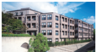
ケアセンターひまわり