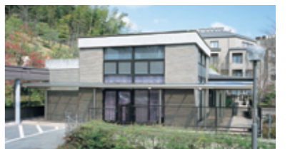
ケアセンターこすもす