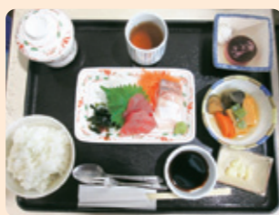
A お刺身盛り合わせ 炊き合わせ/ご飯/香の物/ 茶碗蒸し/ダブルベリームースケーキ