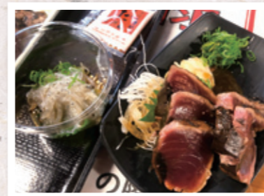
写真2 どろめ(左)と 蕁焼きのカツオのたたき(右)