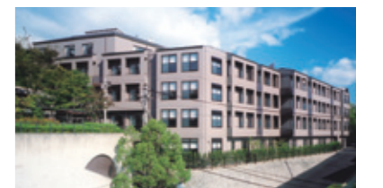
ケアセンターひまわり