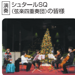
演奏 シュターールSQ (弦楽四重奏団)の皆様

バレエ音楽「くるみ割り人形」童話に基づいた中から親しみやすい8曲を物語付きでご披露いただきました。