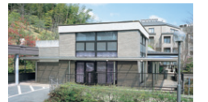
ケアセンターこすもす