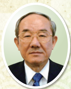
社会福祉法人京都社会事業財団 ライフ・イン京都診療所 所長