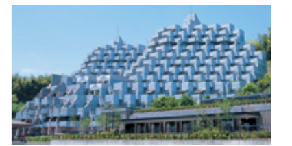
ライフ・イン京都