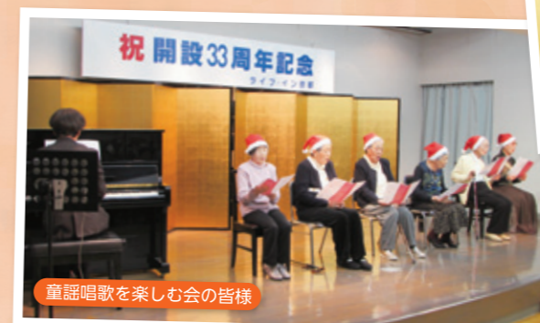
童謡唱歌を楽しむ会の皆様