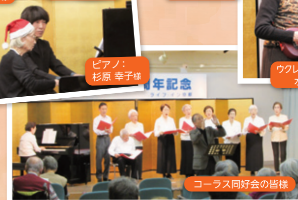
コーラス同好会の皆様