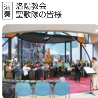
演奏 洛陽教会 聖歌隊の皆様

とても透き通った歌声、また馴染みのある曲も多かったため一緒に曲を口ずさんで楽しいひとときでした。