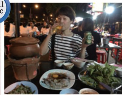
屋台で食べたタイスキ