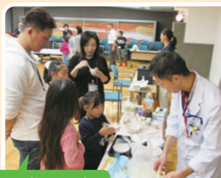
とろみ茶・ソフト食を食べてみよう

ホーム近隣の親子と交流を通じ、介護のしごとの魅力を伝える取り組みとして開催いたしました。