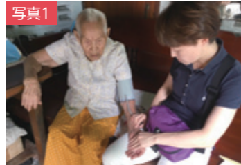
写真1 タイの109歳の高齢者